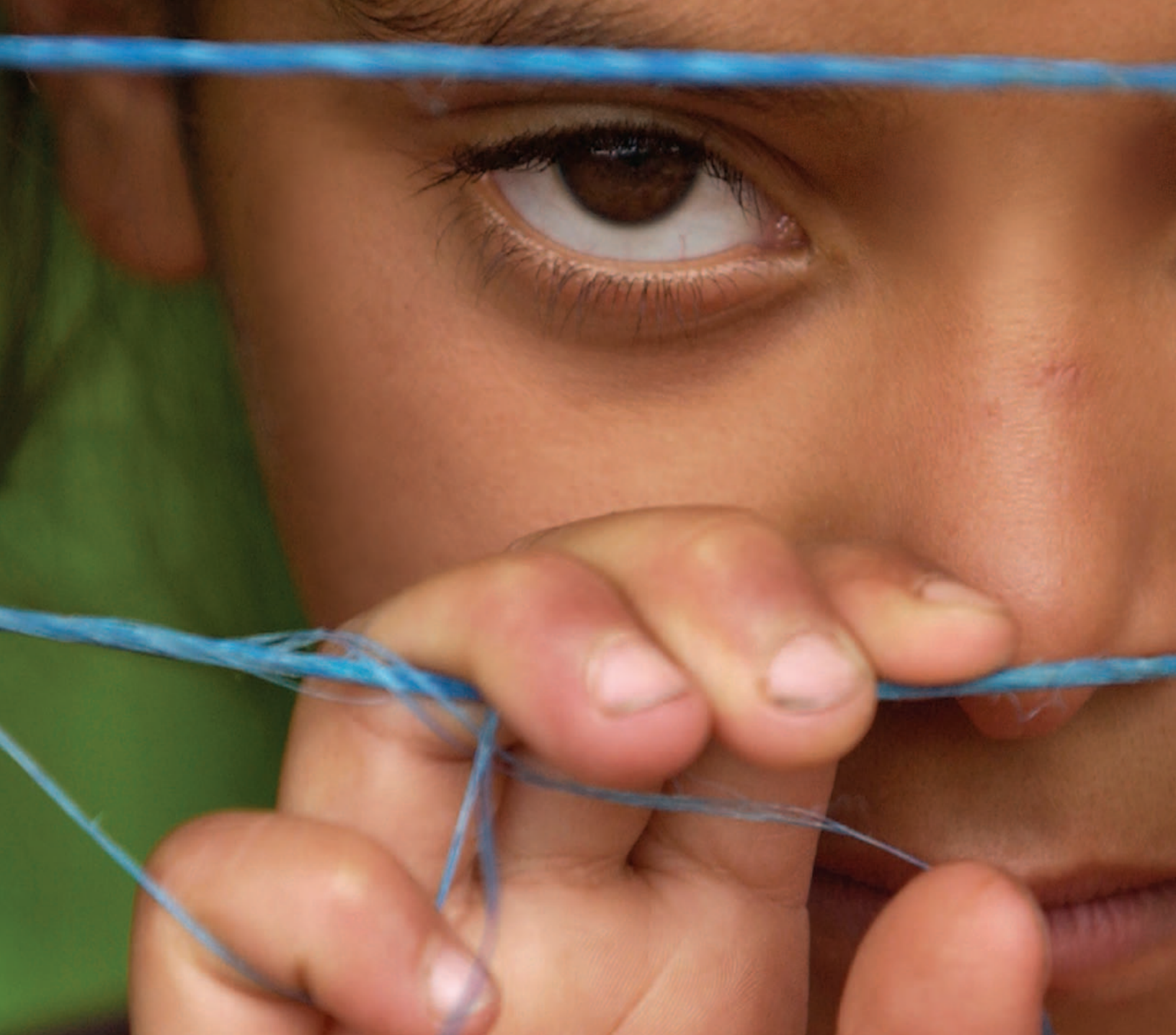
Jeune fille du Nicaragua © Ivanoh Demers / Reporters Communication.