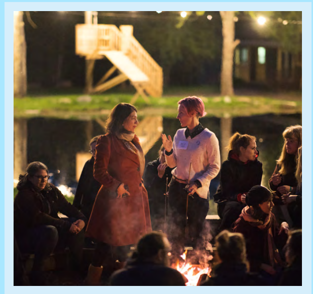
Retraite communautaire à Orford, QC, 2019