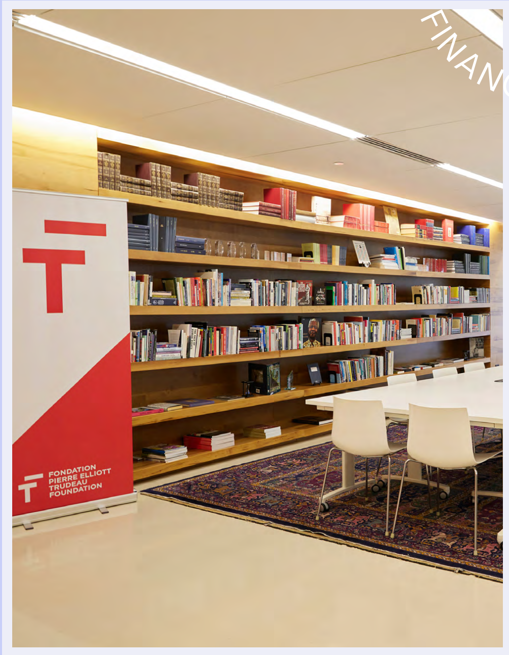
Bureaux de la Fondation, Montréal (Québec)