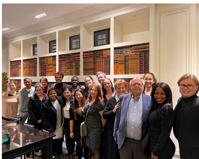
Cohorte 2021, Québec, QC.