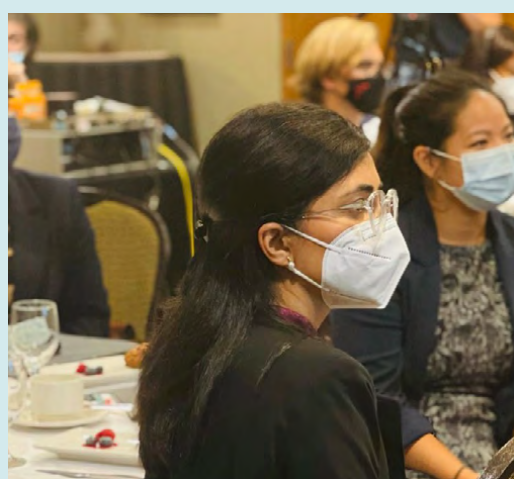
Boursier.e.s 2021, Québec, QC.

Le Comité sur les impacts de la COVID-19 de la Fondation a continué son travail important de mobilisation et d'éducation du public sur les implications de la COVID-19, à la lumière des quatre thèmes fondateurs de la Fondation – les droits de la personne et la dignité humaine; la citoyenneté responsable; le Canada et le monde; et les populations et leur environnement naturel. En créant le comité sur les impacts de la COVID-19, la Fondation cherchait à amplifier la voix des expert.e.s de sa communauté dans le discours public.