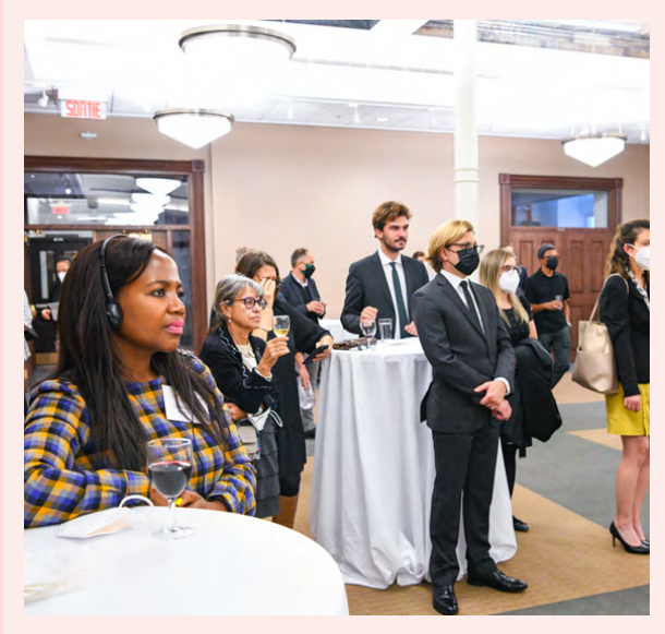
Quelques membres de la cohorte 2021 lors d'une rencontre à Québec, QC.