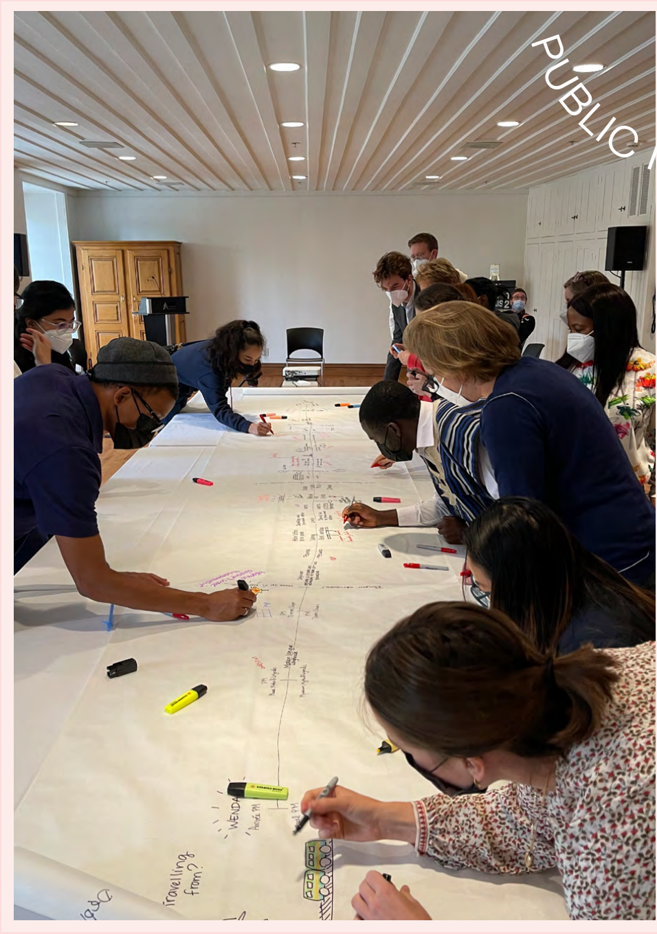
Cohorte 2021, Québec, QC.