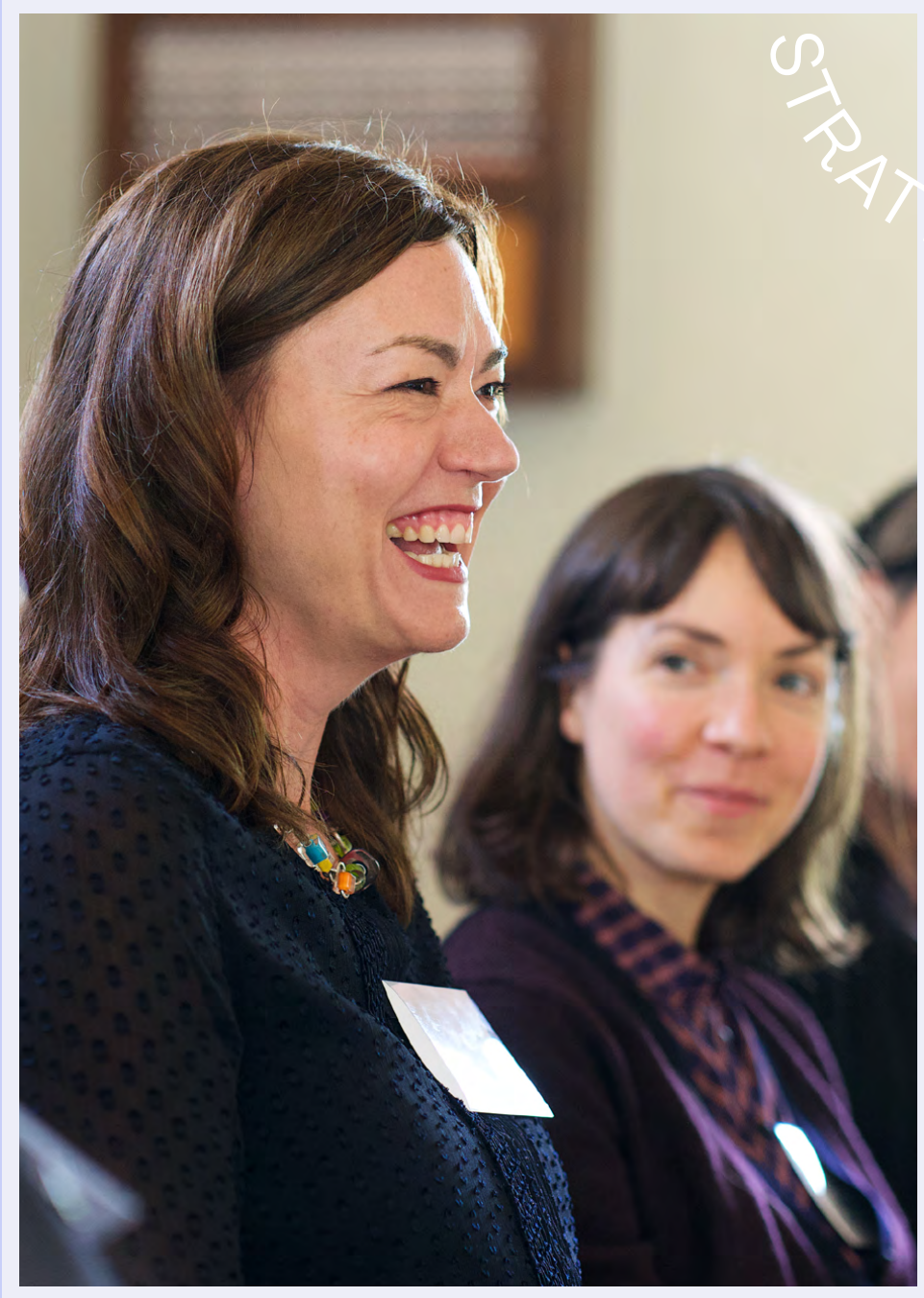
Membres de la cohorte 2019, Yellowknife (T.N-O.), 2019