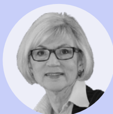
La très honorable Beverley McLachlin Mentore 2020