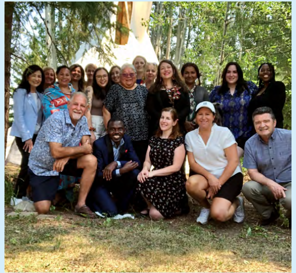
Espace de guérison, de réflexion et de réconciliation, Edmonton, AB, juillet 2021