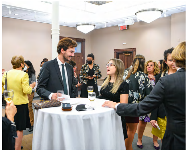
La cohorte 2021 lors de notre rassemblement à Québec, QC.