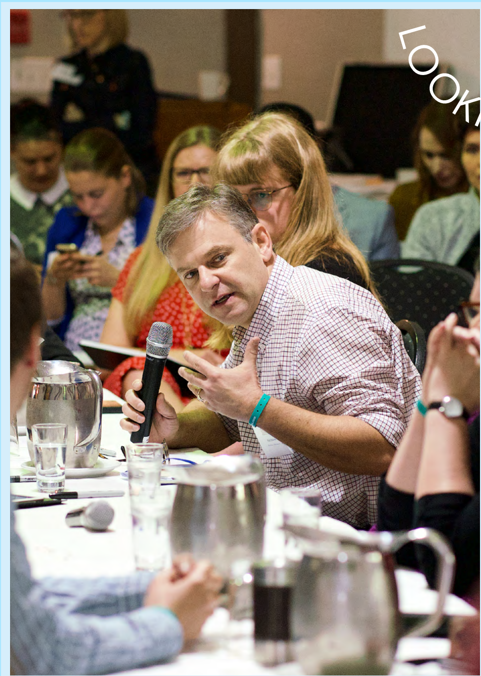
Retraite communautaire, Orford (Québec), 2019