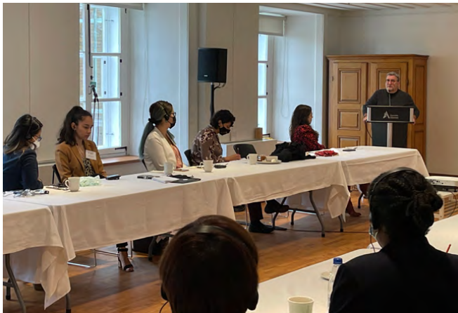
Membres de la cohorte 2021, Québec, QC.

En plus d'un financement généreux pour leurs études, les boursier.e.s reçoivent une formation en leadership durant les trois ans du programme. Celui-ci vise à former des leaders engagé.e.s, outillant des candidat.e.s au doctorat exceptionnel.le.s, des compétences requises pour transformer leurs idées en actions et contribuer à l'avancement de leurs communautés, au Canada et ailleurs dans le monde.