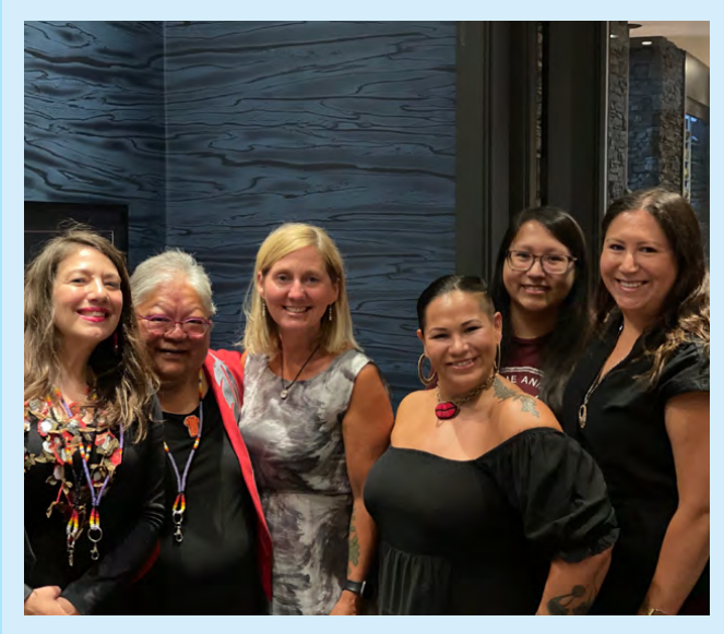
Espace de guérison, de réflexion et de réconciliation, Edmonton, AB, juillet 2021