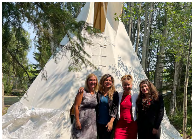
Boursier.e.s et ancienne.s, Espace de guérison, de réflexion et de réconciliation, Edmonton (Alberta), 2021